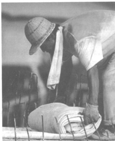
工人浇灌混凝土后,铺上厚厚的塑料布